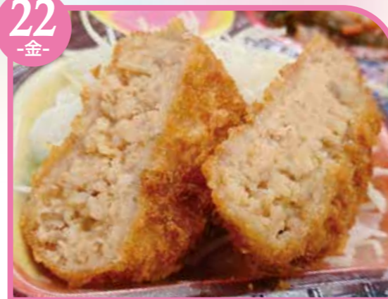
チーズメンチカツ