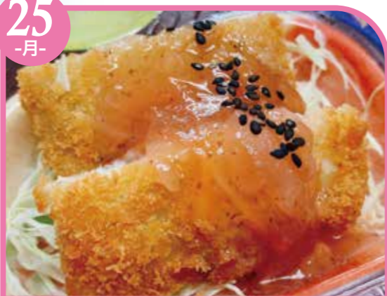
フィッシュフライ梅ソース