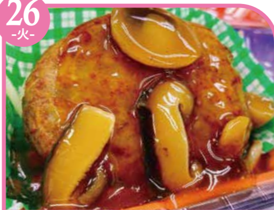
ハンバーグ和風あん