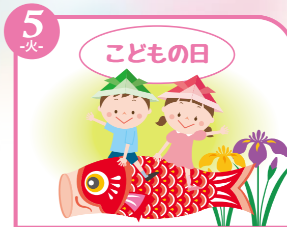
5 -火- 振替休日