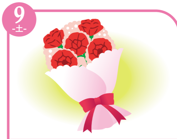
9 -土- デミグラスハンバーグ