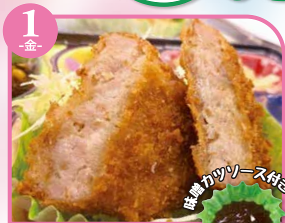
1 -金- 味噌カツ エネルギー309kcal / タンパク質11.7g / 脂質15.6g

栄養成分表記はおかずのみの成分値です。 ご飯は、100gあたり168kcalです。