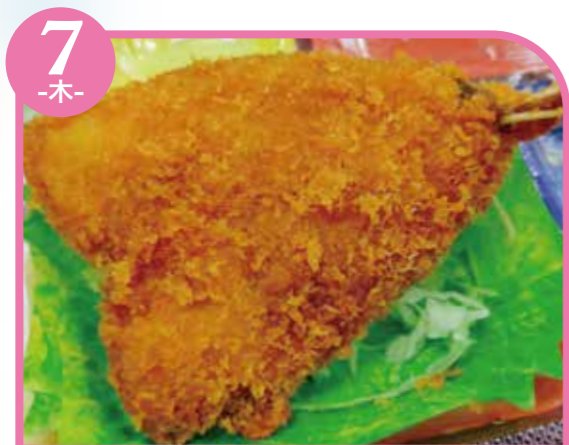
7 -木- アジフライ エネルギー284kcal / タンパク質12.2g / 脂質14.3g