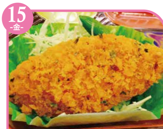
15 -金- カレーウフライ