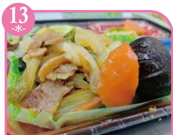
13 -水- かぼちゃクノーデル