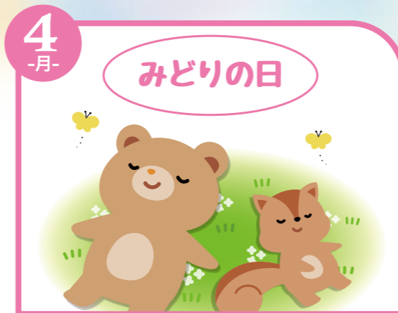
4 -月- こどもの日