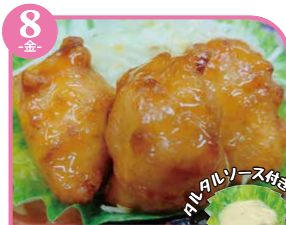
8 -金- チキン南蛮 エネルギー443kcal / タンパク質12.4g / 脂質30.8g