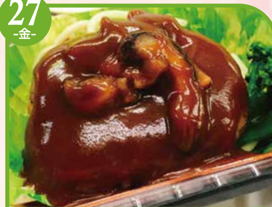
ハンバーグデミソース