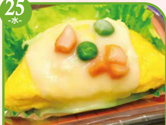
オムレツホワイトソース