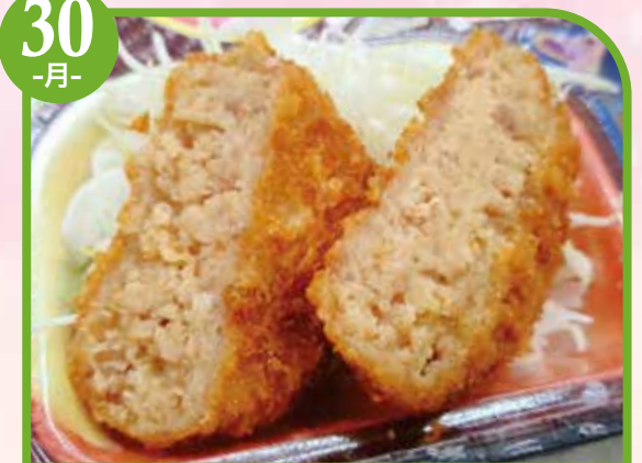
チーズメンチカツ