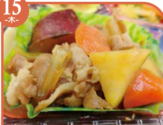
豚とさつま芋の甘辛煮