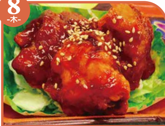
ヤンニョムチキン