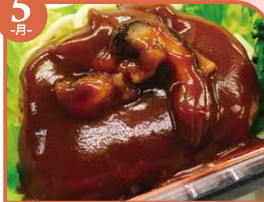
ハンバーグデミソース